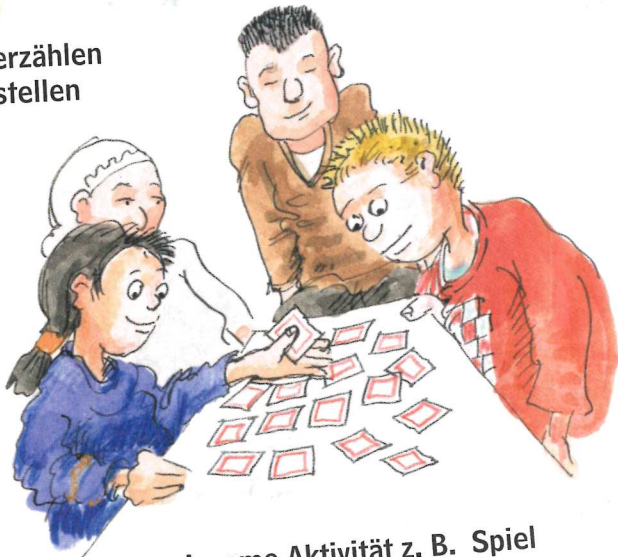
gemeinsame Aktivität z. B. Spiel