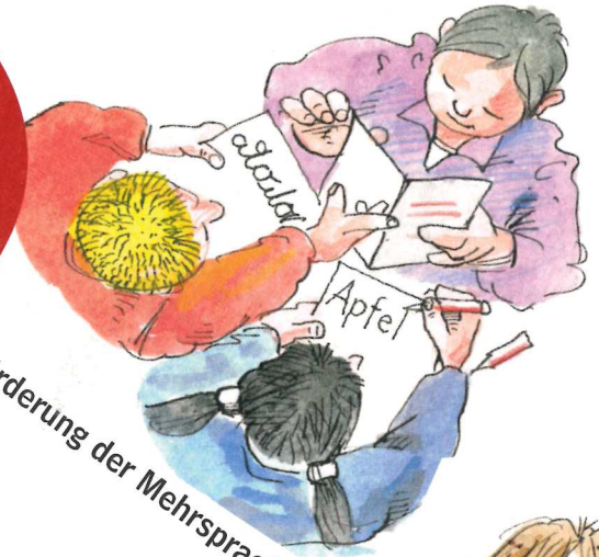
Förderung der Mehrsprachigkeit