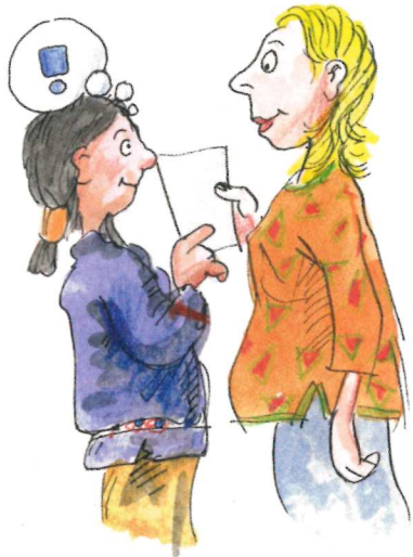
Im Dialog – erzählen und Fragen stellen

Das Programm Rucksack Schule richtet sich kostenfrei an Eltern und ihre Kinder vom ersten bis zum vierten Schuljahr sowie an die Grundschulen. Kinder sollten auf dem Weg zum Schul- und Bildungserfolg von den Eltern unterstützt und begleitet werden (Hausaufgaben, Lesen, gemeinsame Aktivitäten usw.) Die Landeshauptstadt Hannover ermöglicht deshalb in enger Zusammenarbeit mit vielen Grundschulen allen Eltern und Kindern die Sprachkompetenz, Mehrsprachigkeit und Interkulturalität zu fördern.